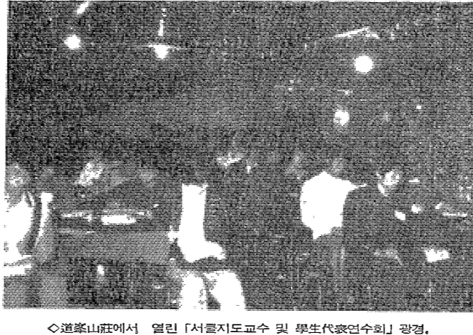
◆道峯山에서 열린 「서클지도교수 및 學生代表인수회」 會景.

서클활동의 범위와 방향을 정하는 데 있어서는 무엇보다도 학생들의 자발적 참여와 자율적 운영이 중요하다고 지적하였다. 서클의 존재 이유는 학생들의 학업, 생활, 문화적 욕구를 충족시키고, 상호교류의 기회를 제공하는 데 있다. 그러나 최근 들어 서클의 수가 급증하면서 질보다는 양을 중시하는 경향이 나타나고 있다. 이는 학생들의 부담을 가중시키고, 오히려 학업에 방해가 되는 결과를 초래하고 있다. 따라서 서클의 활동을 제한하고, 질 높은 활동을 할 수 있도록 하는 것이 필요하다. 이를 위해서는 학교에서 서클 지도교수와 학생대표인수회를 구성하여, 서클의 등록, 운영, 평가 등을 체계적으로 관리해야 한다. 또한, 서클의 활동을 학업과 조화롭게 할 수 있도록 지원해야 하며, 학생들의 자발적 참여를 유도하는 분위기를 조성해야 한다.