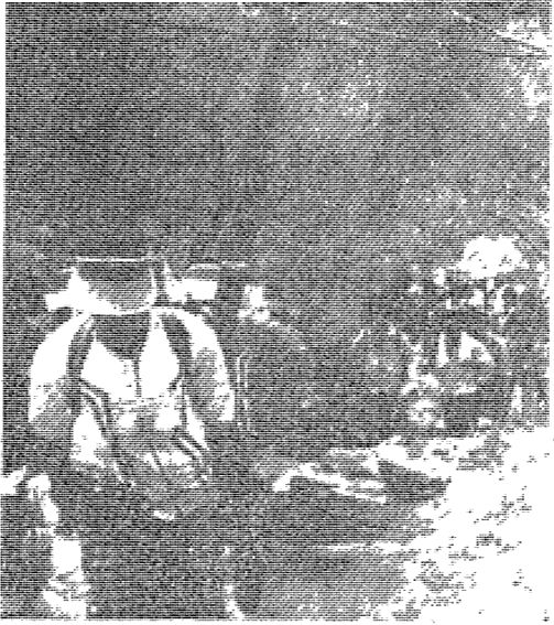
4월의 北漢山에서 協同의 기개를 펼친 東國人登山대회의 참가자들. (左) 李道根, (右) 趙武榮

4·19義舉기념 第9回 東國人 登山大會가 18일 4월 18일 北漢山에서 協同의 기개를 펼친 東國人登山대회의 참가자들. 이번 대회에는 100여명의 東國인들이 참가하여, 北漢山의 奇麗한 風景을 감상하고, 協同의 友誼를 돈독히 다졌다고 한다.