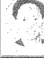
李鍾燦 < 敬啟者 >

成年理想... (Article discussing the ideal of adulthood and the responsibilities that come with it.)