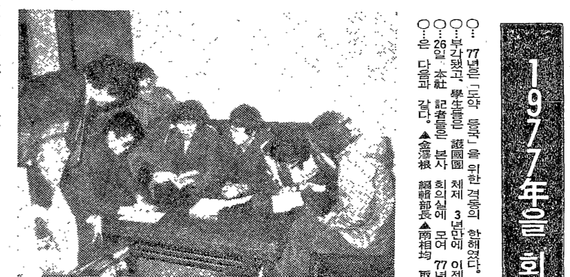
△77년을 회고하는 新築記者들.

△77년 1월 1일부터 12월 31일까지의 新築 동향은 △77년 1월 1일부터 12월 31일까지의 新築 동향은 △77년 1월 1일부터 12월 31일까지의 新築 동향은