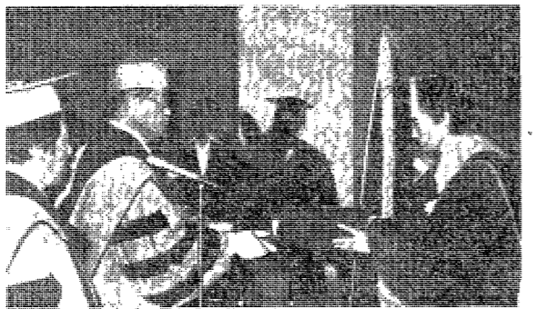
○76學年度 大學院 後期 學位授與式이 지난 10日 綜合세미나실에서 있었다.

護國團등 豫算公開原則 卒業論文指導 協調當부 【本報訊】福社會館等公共設施將進行修繕工程。護國團等團體將公開預算。此外，畢業論文指導將由相關部門負責協調。