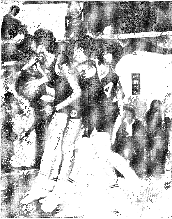
△大會참관인 지난 23日 男高部경기에서 리바운드볼을 다루고 있는 東大附屬의 明知高.