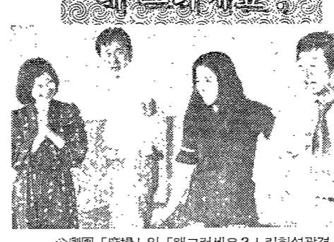
△劇團「廣濟」의 「왜그리세요?」 리허설 장면