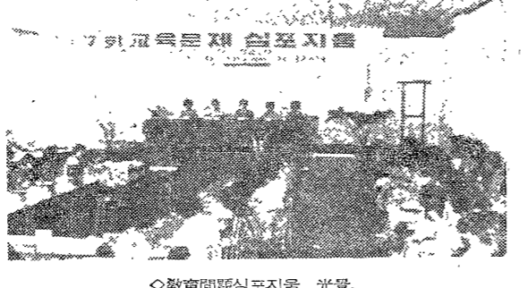
教育問題 심포지움 盛了

安保講演會 開催 「韓半島狀況과 北韓 戰略」 本校 安保講演會 開催 「韓半島狀況과 北韓 戰略」