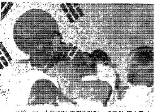
第一回 大學論壇 講演會 會場, 多數의 學生들이 出席하여 熱烈한 反應을 보였다.