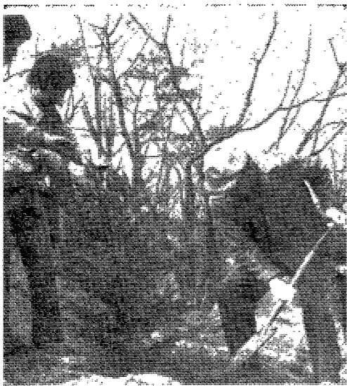
△지난 5일 李總長이 紀念植樹를 하고 있다. (On the 5th, the President performed a commemorative tree-planting ceremony.)