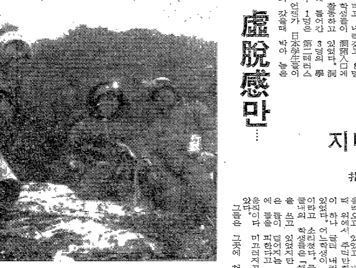
洞窟에 들어선 자의 모습. 오른쪽이 출구 방향이다.

우리는 대학 생활을 어떻게 설계해야 할까? 그것은 기초교육에서부터 시작해야 한다. 기초교육이란 단순히 지식의 전달이 아니라, 학습의 방법과 태도를 익히는 과정이다. 이 기초가 튼튼해야 대학의 三大機能, 즉 知識의 습득, 技術의 연마, 道徳의 수양을 제대로 할 수 있다. 또한, 대학 생활에는 朝氣와 野望을 두어야 한다. 朝氣란 아침의 햇살처럼 밝고 활기찬 마음을 말하며, 野望이란 넓은 시야와 꿈을 말한다. 이 두 가지를 함께 가지고 대학 생활을 설계해야 진정한 대학 생활을 할 수 있다.