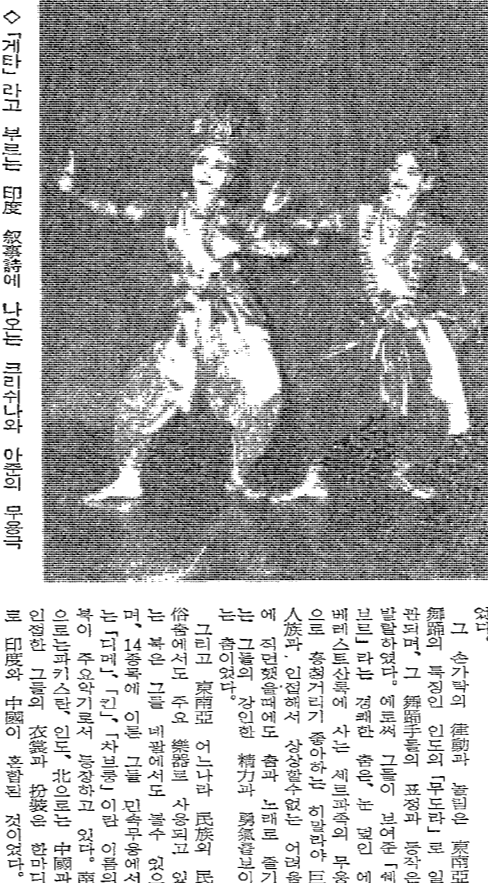
國家間 文化交流와 親善도

相異한 文化傳統, 歷史代辯 固有 娛樂, 精神기질들 國家間 文化交流와 親善도. 이번 인터뷰에서는 國家間 文化交流와 親善도. 이번 인터뷰에서는 國家間 文化交流와 親善도. 이번 인터뷰에서는 國家間 文化交流와 親善도.