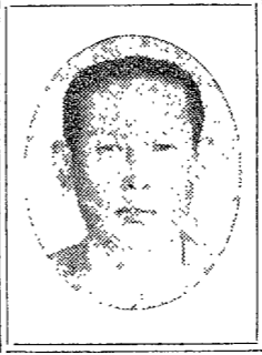
이 著의 著者는 經濟學 博士인 김대중이다.

消費生活의 健全化는 國家의 經濟發展에 直接의 影響을 與한다. 健全한 消費生活은 國家의 經濟를 健全히 發展케 하는 唯一의 途徑이다. 健全한 消費生活은 國家의 經濟를 健全히 發展케 하는 唯一의 途徑이다. 健全한 消費生活은 國家의 經濟를 健全히 發展케 하는 唯一의 途徑이다. 健全한 消費生活은 國家의 經濟를 健全히 發展케 하는 唯一의 途徑이다. 健全한 消費生活은 國家의 經濟를 健全히 發展케 하는 唯一의 途徑이다. 健全한 消費生活은 國家의 經濟를 健全히 發展케 하는 唯一의 途徑이다. 健全한 消費生活은 國家의 經濟를 健全히 發展케 하는 唯一의 途徑이다. 健全한 消費生活은 國家의 經濟를 健全히 發展케 하는 唯一의 途徑이다. 健全한 消費生活은 國家의 經濟를 健全히 發展케 하는 唯一의 途徑이다.