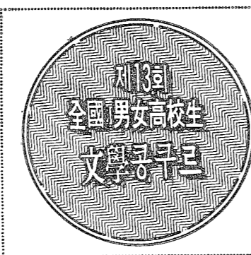
全 國 女 生 高 校 文 學 會 刊

『 小 說 部 各 作 一 首 』 『 小 說 部 各 作 一 首 』 『 小 說 部 各 作 一 首 』