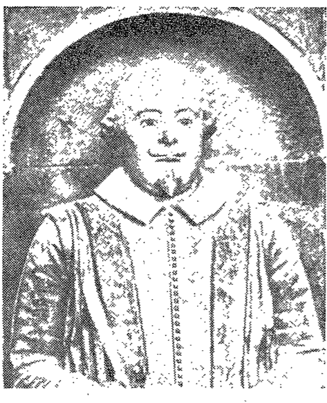
세익스피어가 洗滌를 받았으며, 또한 그의 기쁨을 표현한 반신상

세익스피어는 400주년을 맞이하며, 그의 예술적 업적과 현대적 의의에 대해 살펴보았다. 그의 작품은 인간의 내면을 깊이 탐구하여, 오늘날에도 많은 사람들에게 감동을 주고 있다. 그의 작품은 단순한 이야기의 차이를 넘어, 인간 존재의 본질을 파헤치려는 시도가 담겨 있다. 특히 그의 비극은 인간의 운명, 사랑, 죽음, 권력 등 다양한 주제를 다뤄, 보편적인 가치를 전달하고 있다. 또한, 그의 희극은 사회의 모순과 인간의 어리석음을 풍자하여, 웃음을 통해 진리를 깨닫게 하는 역할을 했다. 그의 언어는 시적이고 웅장하며, 독자들에게 깊은 울림을 준다. 세익스피어의 작품은 현대 문학에 지대한 영향을 미쳤으며, 오늘날에도 수많은 작가들이 그의 작품을 모범으로 삼고 있다. 그의 예술적 유산은 영원히 빛을 발할 것이다.