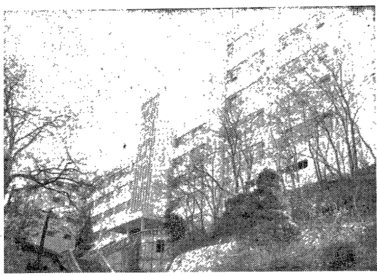
▲圖中爲 建築中 教育學館의 內景