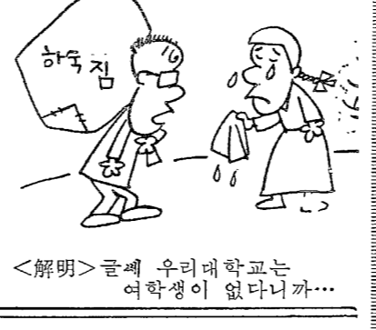
합격 유망, 유망생 이복