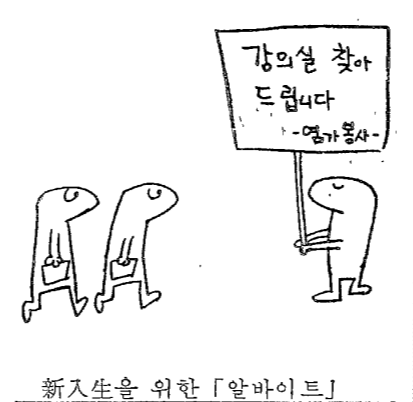
신인생을 위한 '달바이트'

○ 1973년 9월 1일부터 9월 30일까지 전국 대학에 입학한 신인생 1,120명(1,120명)의 입학 현황을 살펴본다. ○ 1973년 9월 1일부터 9월 30일까지 전국 대학에 입학한 신인생 1,120명(1,120명)의 입학 현황을 살펴본다. ○ 1973년 9월 1일부터 9월 30일까지 전국 대학에 입학한 신인생 1,120명(1,120명)의 입학 현황을 살펴본다.