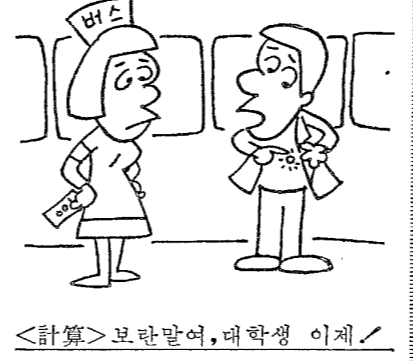
계산 보라만입, 토학생 이복