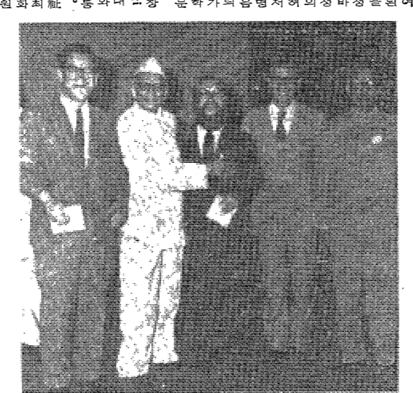
산스크리트어 학회 참가보고 사진