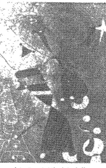
△인상 깊은 모습의 학생들

『대학의 체육』이라는 제목의 기사를 읽고 있는데, 체육이 인성교육의 중요한 수단임을 인식해야 한다는 내용이 인상 깊었다. 특히, 체육이 단순히 건강을 위한 것이 아니라, 인성을 함양하고, 사회생활에 필요한 능력을 기르는 데도 중요하다는 점을 강조하고 있다. 대학에서는 학생들의 체력을 강화하고, 건강한 인재를 길러내기 위해 체육을 적극적으로 지원해야 한다. 그러나 현재 우리 대학에서는 체육 시설이 부족하고, 체육 예산이 충분하지 않다. 이러한 문제를 해결하기 위해서는 대학 당국과 사회의 협력이 필요하다. 체육은 인체의 건강을 증진시키고, 정신적 안정을 가져다 준다. 또한, 협동심과 리더십을 함양하는 데도 큰 역할을 한다. 대학에서는 학생들의 체력을 강화하고, 건강한 인재를 길러내기 위해 체육을 적극적으로 지원해야 한다.