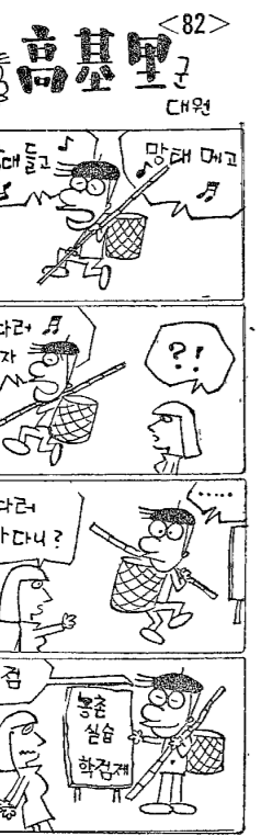
△인상 깊은 모습의 학생들

『대학의 체육』이라는 제목의 기사를 읽고 있는데, 체육이 인성교육의 중요한 수단임을 인식해야 한다는 내용이 인상 깊었다. 특히, 체육이 단순히 건강을 위한 것이 아니라, 인성을 함양하고, 사회생활에 필요한 능력을 기르는 데도 중요하다는 점을 강조하고 있다. 대학에서는 학생들의 체력을 강화하고, 건강한 인재를 길러내기 위해 체육을 적극적으로 지원해야 한다. 그러나 현재 우리 대학에서는 체육 시설이 부족하고, 체육 예산이 충분하지 않다. 이러한 문제를 해결하기 위해서는 대학 당국과 사회의 협력이 필요하다. 체육은 인체의 건강을 증진시키고, 정신적 안정을 가져다 준다. 또한, 협동심과 리더십을 함양하는 데도 큰 역할을 한다. 대학에서는 학생들의 체력을 강화하고, 건강한 인재를 길러내기 위해 체육을 적극적으로 지원해야 한다.