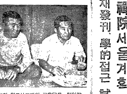
禪院 禪院세울 계획