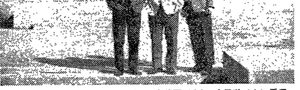
이양일대학에서 宗敎學교수(左), 宗敎學(右), 宗敎學(中)의 宗敎學

이양일대학은 宗敎學, 社會學, 文化人類學을 연구하는 대학이다. 이양일대학은 宗敎學, 社會學, 文化人類學을 연구하는 대학이다.