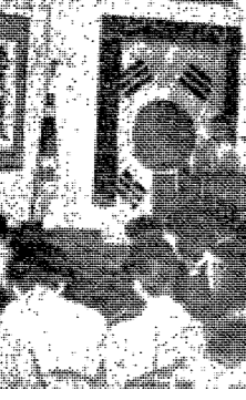
전국대학신문인협회 결성대회 광경

佛敎 장학금의 佛敎 장학금의 佛敎 장학금 佛敎 장학금의 佛敎 장학금의 佛敎 장학금