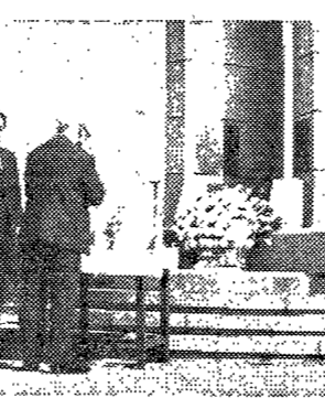
△동우회에서 분향하는 송충장.

본교 郵遞局 개국 15일 石道館東쪽에 본교 郵遞局 개국 15일 石道館東쪽에 4월 18일 15시 30분부터 19시 30분까지 1971년 4월 19일