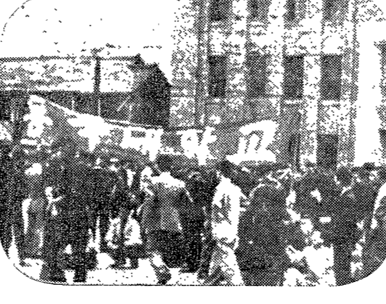
본회의集結 海務廳 海務廳 海務廳