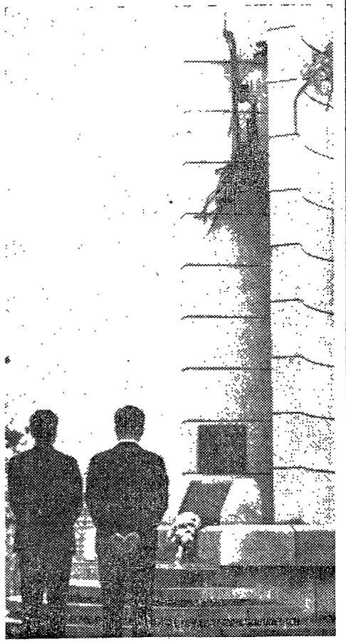
東友塔... 무엇을 잘못하고 자유인수후신 盧鳳斗등은