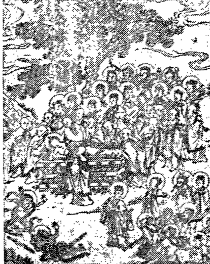
覺은 通路 따로 없다의 插圖

覺은 通路 따로 없다... (Article discussing the path to enlightenment.)