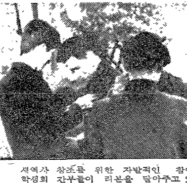
새校風 캠페인 活발