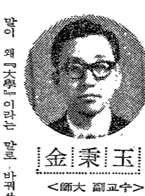
金秉五 서울대학교 대학원장

이러한 변화에 대응하기 위하여 대학은 여러 가지 개혁을 추진하고 있다. 첫째, 학제 개혁을 통해 보다 유연하고 다양한 학제 체계를 구축하고 있다. 둘째, 교육 내용의 현대화를 통해 학생들에게 최신의 지식과 기술을 전달하고 있다. 셋째, 대학 운영 방식의 개혁을 통해 보다 효율적이고 투명한 대학 운영 체계를 구축하고 있다. 이러한 개혁을 통해 대학은 보다 나은 교육 환경을 조성하고, 학생들에게 보다 나은 교육을 제공할 수 있을 것이다. 이는 궁극적으로 국가와 사회에 보다 나은 인재를 양성하는 데 기여할 것이다.