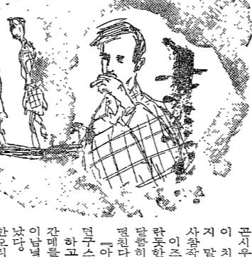
모험기 (徐賢碩 그림)