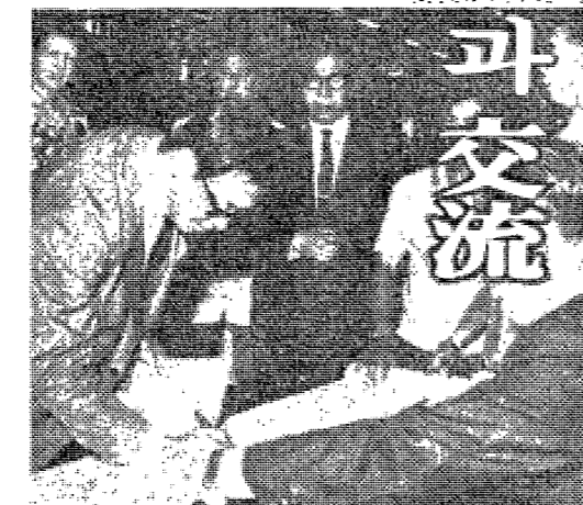
제3차 디자인작업회의에서 演習을 指導하는 先生들

조직적인 演習사업 간요. 이 사업은 學生들의 組織力을 培양하고, 演習을 正當히 進행시키는 爲에 設치된 것이다. 이 사업은 學生들의 組織力을 培양하고, 演習을 正當히 進행시키는 爲에 設치된 것이다.