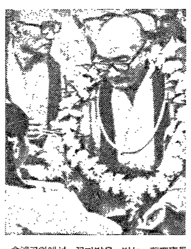
金清峯에서 광다발을 받는 蔡理事長