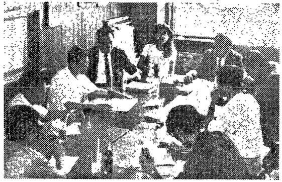
학생들이 모여서 토론하고 있다. (학생들의 토론 모습)

여름방학이 다가왔다. 우리 대학생들은 어떻게 여름방학을 보낼 것인가? 이 문제를 생각해 보자. 여름방학은 학업의 피로에서 벗어나 휴식을 취할 수 있는 좋은 기회이다. 그러나 단순히 놀기만 하는 것은 아니다. 학업에 대한 흥미와 열정을 되찾고, 사회생활에 대한 준비를 하는 것도 중요하다. 이번 여름방학은 어떻게 보낼 것인가? 이 문제를 생각해 보자.