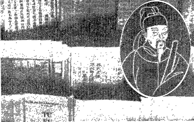
杜南園先生 所藏本의 一節과 杜甫先生(圖內)

장기傳은 朴堤千의 詩를 集한 詩集이다. 이 詩集은 朴堤千의 詩를 集한 詩集이다. 이 詩集은 朴堤千의 詩를 集한 詩集이다. 장기傳은 朴堤千의 詩를 集한 詩集이다. 이 詩集은 朴堤千의 詩를 集한 詩集이다. 이 詩集은 朴堤千의 詩를 集한 詩集이다.