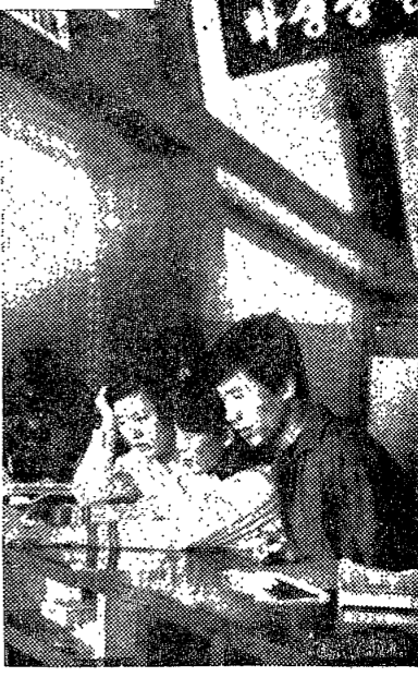
學生指導研究所 別館에 즈음하여

○「교육의 효율성」은 학생의 학습 동기와 학습 방법의 적절성에 달려 있다. 학생들은 학습에 대한 흥미와 동기를 유지할 수 있도록 해야 한다. 또한, 학습 방법을 익혀서 효율적으로 학습할 수 있도록 지도해야 한다. 학생들은 학습 목표를 설정하고, 계획을 세우고, 실천하며, 평가를 받는 과정을 반복해야 한다. 이를 통해 학습의 효율성을 높일 수 있다.