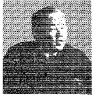
20년 동안 市廳의 일꾼이 된 母校에 관심 많은 廳長