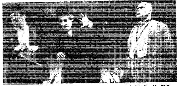
1955년 연극공연 「고도를 기다리며」의 한 장면

이 단편은 자연의 아름다움과 인간의 감정을 주제로 다룬다. 비 오는 날의 정취와 그 속에서 느끼는 감정을 섬세하게 묘사하여, 독자들에게 깊은 공감을 불러일으킨다. 작가는 자연의 섭리를 통해 인간의 내면 세계를 탐구하며, 삶의 아름다움을 발견하는 과정을 보여준다.