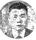
〈著者〉 이 장