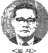
〈著者〉 이 장

暴力犯 등 處罰法의 改正案은 大檢에서 提出한 것이다. 이 법안은 暴力犯의 處罰을 輕減하고, 社會적으로 有害한 犯罪에 對하여는 處罰을 加重한 것이다.