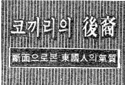
新面目으로 본 東國人的 氣質

1000명 前夜의 祝賀會 【本報訊】前夜(21日)晚間，在東京大學體育館，舉行了由該校學生會主辦的「1000名前夜」祝賀會。當晚出席者有東京大學學生、教職員、以及各界人士，共計一千餘人。會中由學生會主席致詞，勉勵全體同仁，在即將到來的「1000名」紀念日，更加努力，為國家的繁榮與進步，貢獻力量。會中並有精彩的文藝表演，氣氛熱烈。祝賀會於晚間十時許圓滿結束。