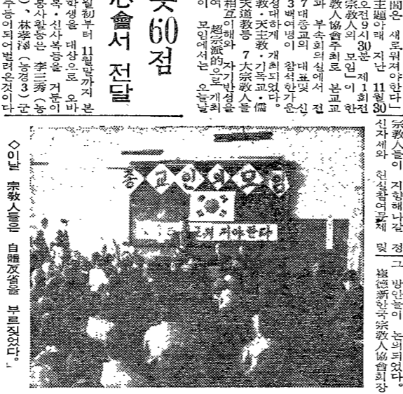
「宗教人의 모임」 盛了