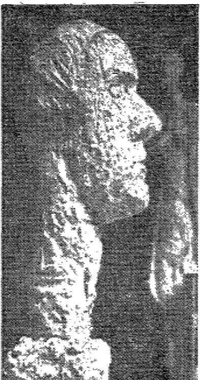
△인물묘사. 자코비타(아르테미의 미완성품)의 인물상을 단점관공에서 出口를 찾고있다.