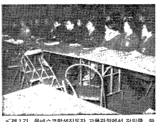
제7기 유네스코학생지도자 교육과정에서 강의를 들은 새물결운동원들. 사진은 KUSA회관에서 2월 5일 수업을 받고 있는 모습이다.

새물결운동은 大學풍토 조성 새물결운동은 학생들의 자발적인 참여로 이루어진다. 이는 학생들의 자발적인 참여로 이루어진다. 이는 학생들의 자발적인 참여로 이루어진다. 이는 학생들의 자발적인 참여로 이루어진다. 이는 학생들의 자발적인 참여로 이루어진다.