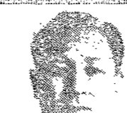
産業大學長 金炳熙

刻苦勤勵의 度가나라의 發展度. 金炳熙先生은 刻苦勤勵의 度가 國家의 發展에 영향을 미친다고 하셨습니다. 그는 國民들이 刻苦勤勵을 하면, 國家의 發展도 촉진된다고 강조하셨습니다.