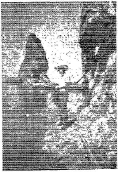
오징어 회 一味 水力發電所도 있는 五多島