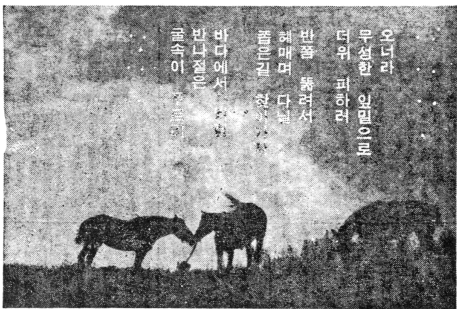
바다에서... (Illustration related to the article 'The Charm of the Sea')

李昌培先生은 文壇의 거목으로, 그의 문필은 항상 시대의 흐름을 선도해왔다. 그는 문학의 본질을 탐구하고, 독자들에게 깊은 감동을 선사하는 작품을 많이 남겼다. 그의 문장은 논리적이고 명료하며, 독자의 마음을 사로잡는 힘이 있다. 그는 문학의 발전을 위해 끊임없이 노력하고, 후배 작가들을 지도하는 데도 많은 공헌을 했다. 그의 문壇 대교수로서의 위상은 누구도 부정할 수 없다.