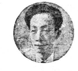
趙演鈞 <文壇大教授·詩論家>

여름은 계절의 정취를 가장 잘 보여주는 때이다. 푸르디 푸른 들녘과 싱그러움 가득한 들꽃들이 여름을 알린다. 여름은 휴식과 여유를 주는 계절이다. 바닷바람이 시원하게 불어오를 때, 해변에서 여유롭게 시간을 보낸다. 여름은 사랑과 낭만의 계절이다. 사랑하는 사람과 함께 해변을 걷고, 시원한 음료수를 마시는 즐거움이 있다. 여름은 우리에게 삶의 여유와 행복을 선사한다. 여름을 즐기며, 삶의 의미를 되새겨보자.