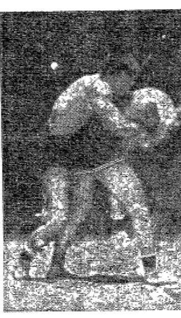
△大東大(左)의 레슬링 선수들

한 달 전부터 시작된 대동대(大東大學)와 동국대(東國大學)의 레슬링 대결은 12일(월) 밤 8시에 동국대 체육관에서 막을 내렸다. 대동대는 10승 1무 1패로 대승을 거두었다.