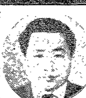
Portrait of the author of the article on religious freedom.