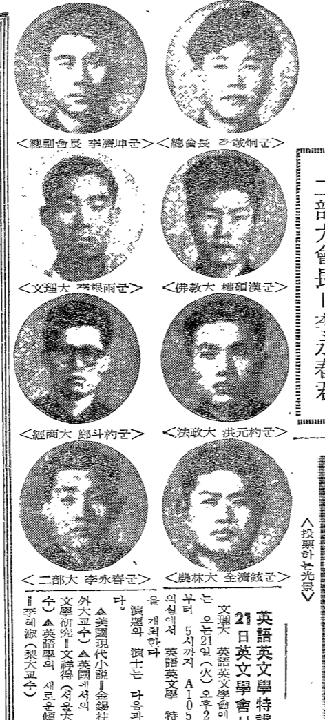
▲投票券光景 (Photograph of a ballot paper)

본교 학생총연합회(이하 학생총연)는 17일(일) 오후 6시 30분부터 8시 30분까지 본교 학생회관에서 16개 선거구에서 진행된 1966년 학생총연합회 회장단 선거의 개표결과를 발표했다. ▲총회장(佛3) 李載炯(佛3) 47표 ▲총서기(佛3) 李載炯(佛3) 47표 ▲총재무(佛3) 李載炯(佛3) 47표 ▲총홍보(佛3) 李載炯(佛3) 47표 ▲총체육(佛3) 李載炯(佛3) 47표 ▲총문화(佛3) 李載炯(佛3) 47표 ▲총학생(佛3) 李載炯(佛3) 47표 ▲총교우(佛3) 李載炯(佛3) 47표 ▲총학생(佛3) 李載炯(佛3) 47표 ▲총교우(佛3) 李載炯(佛3) 47표