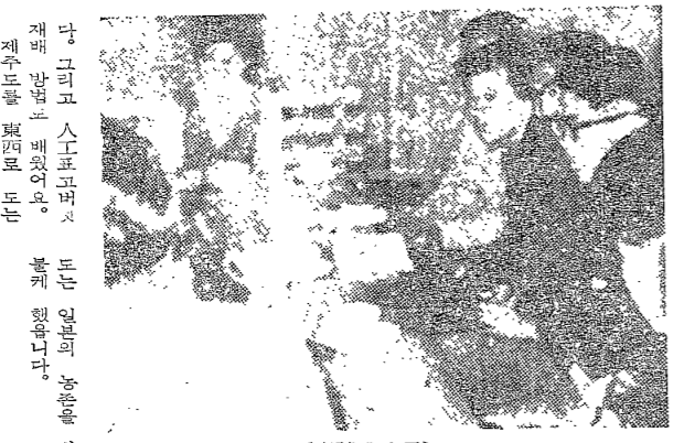
濟州道 地質調査報告書의 要約을 소개한다.