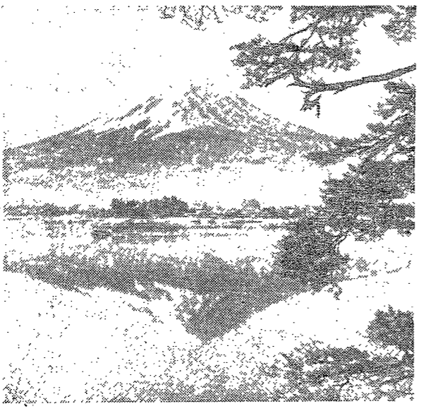
◇萬年雪에 照린 富士山의 雄容◇

富士山의 萬年雪을 밝던 感激! 3,776m의 頂上은 구름위에 富士山의 萬年雪을 밝던 感激! 3,776m의 頂上은 구름위에 富士山의 萬年雪을 밝던 感激! 3,776m의 頂上은 구름위에