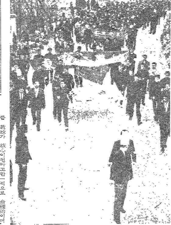
大學街에서 小會를 하는 大學街

大學은 營利化를 脫피해야 한다. 財團과 教授間에 協助를 기대하고, 教授는 受難의 十字架에 高히 서야 한다. 大學의 營利化는 國家의 命脈을 위협하는 存在이다. 財團과 教授間에 協助를 기대하고, 教授는 受難의 十字架에 高히 서야 한다.