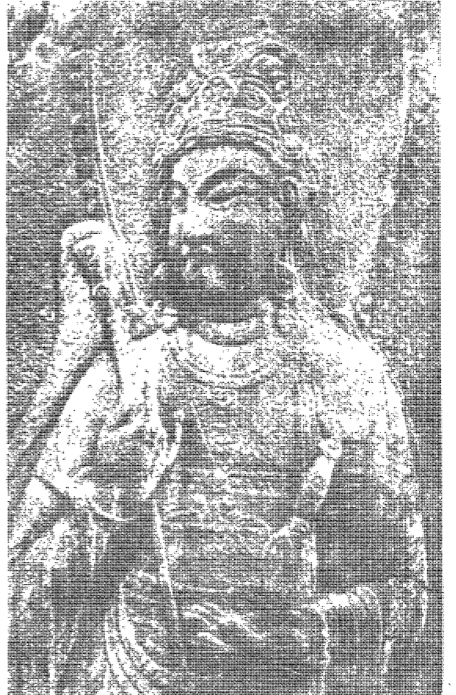
西山大師의 著書와 思想