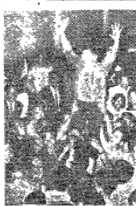
【本報記者 朴正植 攝】