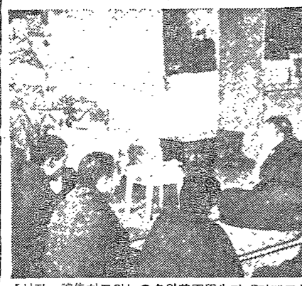
【 사진·정비하고 있는 3명의美國學生과 「티베트」 學僧들】