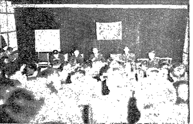
10日, 代議員會가 3차 總會議에서 今年度 豫算案을 通過했다.

會則도大幅改正 女學生部·禪武部를 「會」로昇格 63年度決算報告를 全面承認 10日, 代議員會가 3차 總會議에서 今年度 豫算案을 通過했다. 會則도 大幅改正하고, 女學生部와 禪武部를 「會」로 昇格했다. 63年度 決算報告를 全面承認했다.