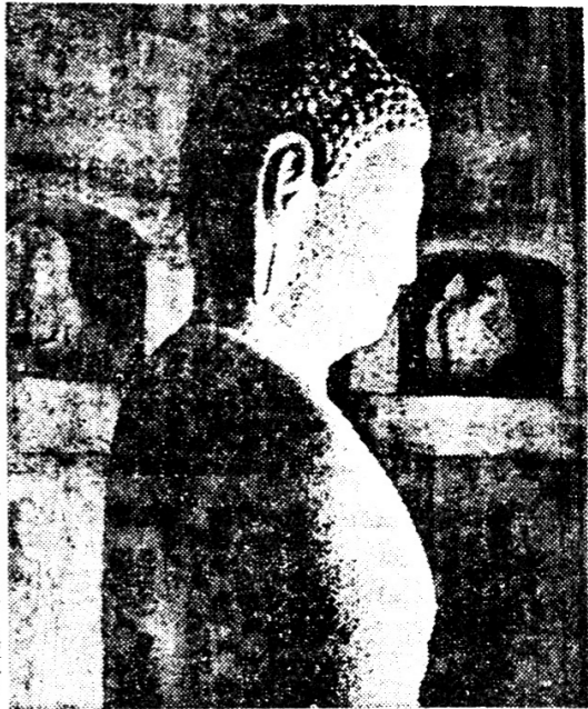
〈廣州 佛國寺의 不摩羅迦如來坐像〉

佛敎은 世界의 主要한 宗教로 發展한 歷史를 有한다. 佛敎의 傳播은 中國을 經由하여 韓國에 傳入된 後, 韓國의 社會, 文化, 藝術에 深遠한 影響을 與하였다. 韓國의 佛敎은 中國의 佛敎과 異なり, 自己의 特色을 有하며, 韓國의 佛敎史는 韓國의 文化史와 密接한 關係를 有한다. 佛敎의 傳播은 中國을 經由하여 韓國에 傳入된 後, 韓國의 社會, 文化, 藝術에 深遠한 影響을 與하였다. 韓國의 佛敎은 中國의 佛敎과 異なり, 自己의 特色을 有하며, 韓國의 佛敎史는 韓國의 文化史와 密接한 關係를 有한다.