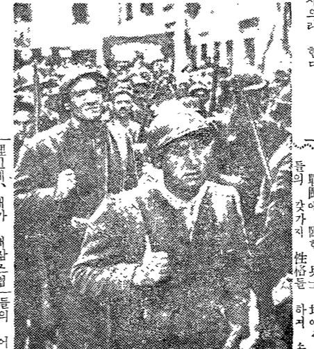
후메니즘바탕의 戰爭 映畫

삼포지움에서 삼포지움에서 삼포지움에서 삼포지움에서 삼포지움에서 삼포지움에서 삼포지움에서 삼포지움에서 삼포지움에서 삼포지움에서.