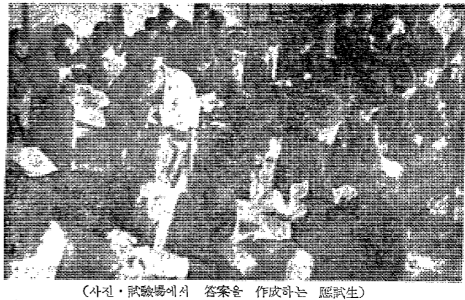
(사진·試驗場에서 答案을 作成하는 應試生)

本校에서는 62年度 學士資格考試 敎養科目試驗을 12月10일부터 12日 까지 120分間에 걸쳐 全國 9個地區 16個試驗場에서 同時에 施行되었으며 나머지 專攻科目은 各大學 單位로 오는 12月3일에 施行된다. 한편 試驗與否를 둘러 하고 발령을 일으켰던 今年度 學士考試 敎養科目試驗은 國語, 英語, 文化史, 自然科學 등으로 全國 四十八個 大學에서 二만五千八百八十一명이 應試者를 提出하여 그중 九九·一퍼센트가 該當하는 二만四千八百六十四名이 시험을 치루어 높은 應試率을 보였고 나머지 二백二十二名이 應試하지 않았다.