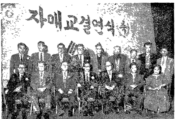
자매교결연식... 자매교결연식... 자매교결연식...