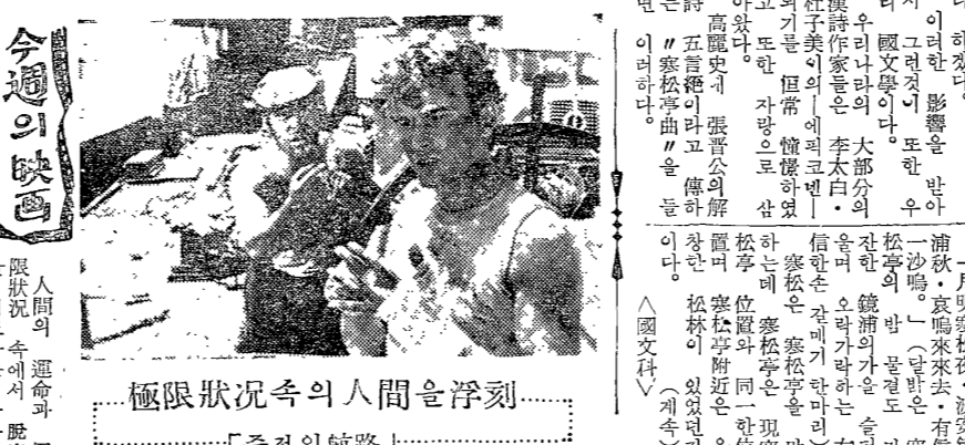
極限狀況속의 人間을 浮刻한 「주정의 航路」

61年 學年 手의 作業 (II) 金元來 手의 作業은 學年의 生活를 反映한 藝術이다. 手의 作業은 學年의 生活를 反映한 藝術이다. 手의 作業은 學年의 生活를 反映한 藝術이다. 手의 作業은 學年의 生活를 反映한 藝術이다. 手의 作業은 學年의 生活를 反映한 藝術이다.