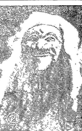
富貴-0兩班에 阿訶하는 '下人'假面 佛敎에 影響을 받은 '중'假面