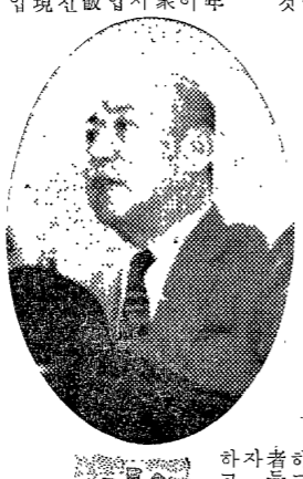
白總長 聖誕節紀念辭(要旨)

(週刊) 月定購費 貳佰圓 一旬定費 五拾圓 今週一言 말이 가벼운 사람은 責任을 지지 않는다. —孟子—