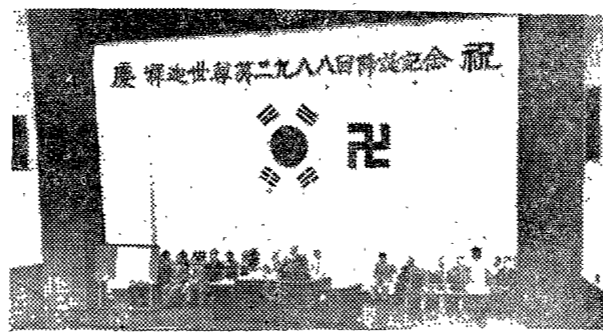
慶祝佛誕紀念式 各界人士踴躍參加