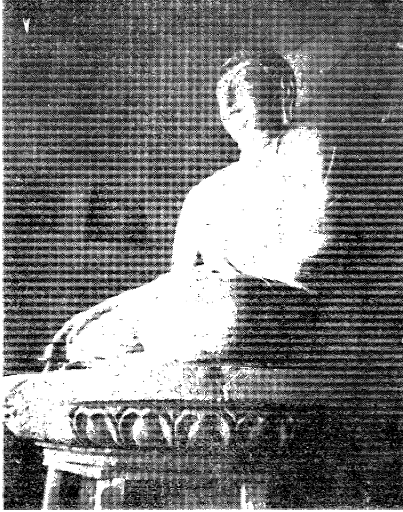
石窟庵石窟釋迦像