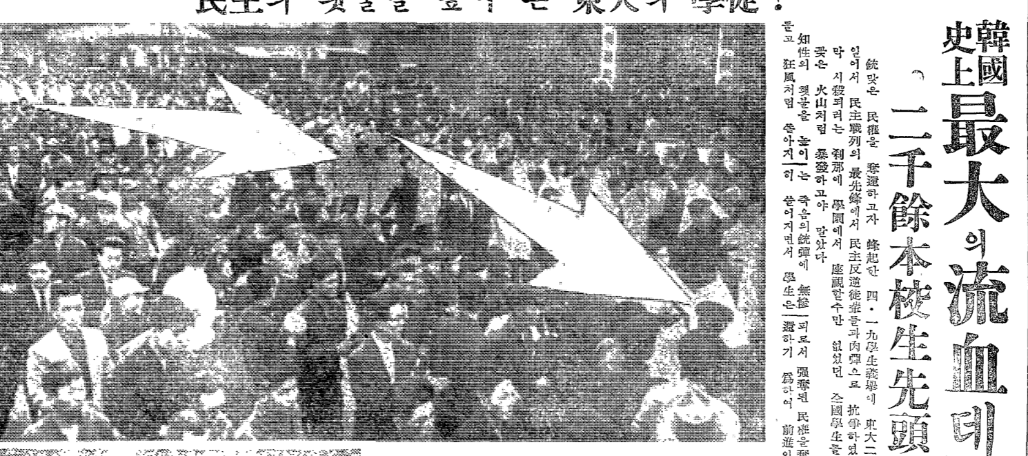
韓國最大의 流血의 모 史上最大의 流血의 모 二千餘本校生先頭에서서

學生側死傷者數百名 先頭에 陣亡한 學生은 數百名에 달한다. 學生들은 敵機의 폭탄에 맞고 죽어갔다. 學生들은 敵機의 폭탄에 맞고 죽어갔다. 學生들은 敵機의 폭탄에 맞고 죽어갔다.